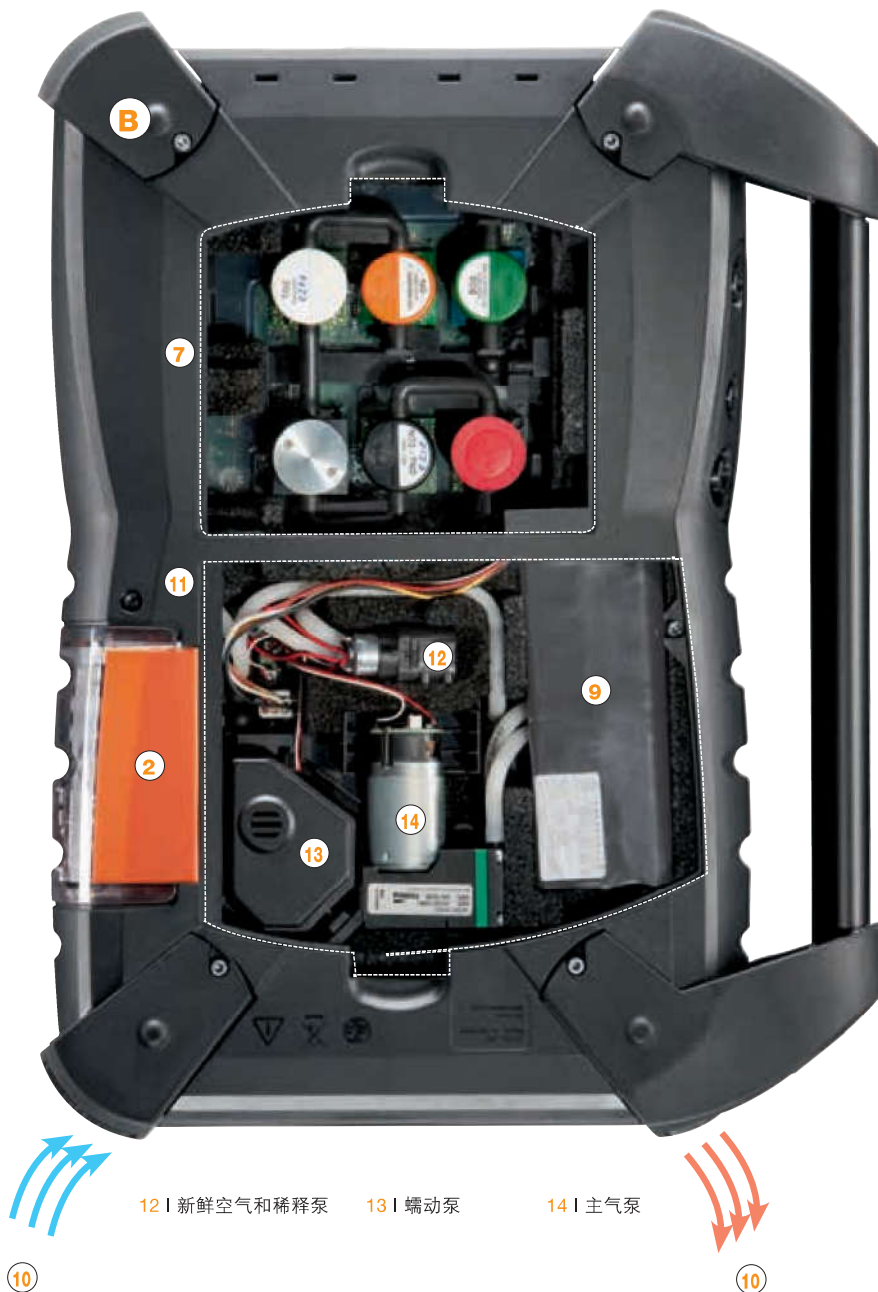
12 | 新鲜空气和稀释泵

可确保在无人值守时，流速和流量的长时间测量，以及在烟气测量的同时进行流速流量的测量。