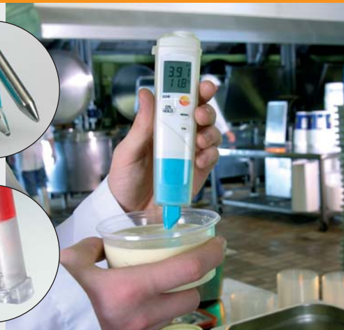
现场检测乳品的 pH 值