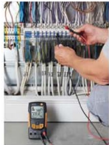
测量开关柜中的电压