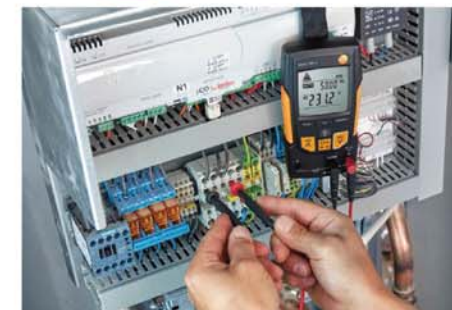
测量热深开关盒中的电压