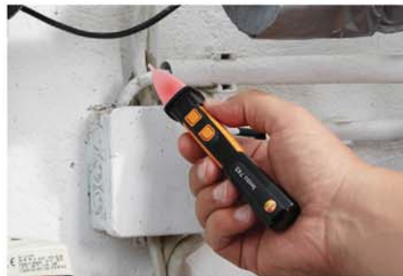
初步检测电源电压