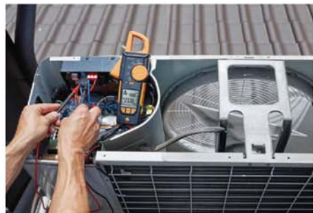
测量空调外机电压